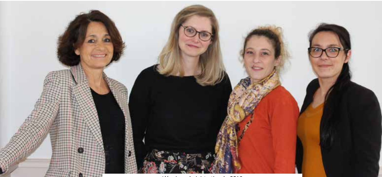
L'équipe administrative du CCAS

Le 06 février dernier, le Conseil d'administration du Centre Communal d'Action Sociale (CCAS) a voté le budget pour l'exercice 2020. Faisons le point sur le fonctionnement du CCAS.