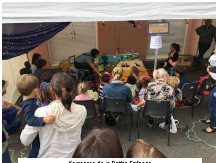
Kermesse de la Petite Enfance