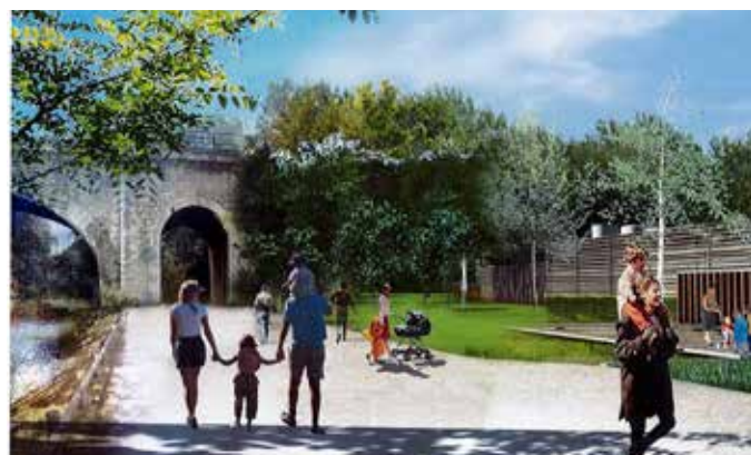
Vue d'artiste du futur aménagement des bords de l'Eure.