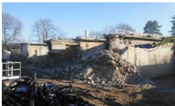
Démolition de l'ancienne station d'épuration en février 2018.