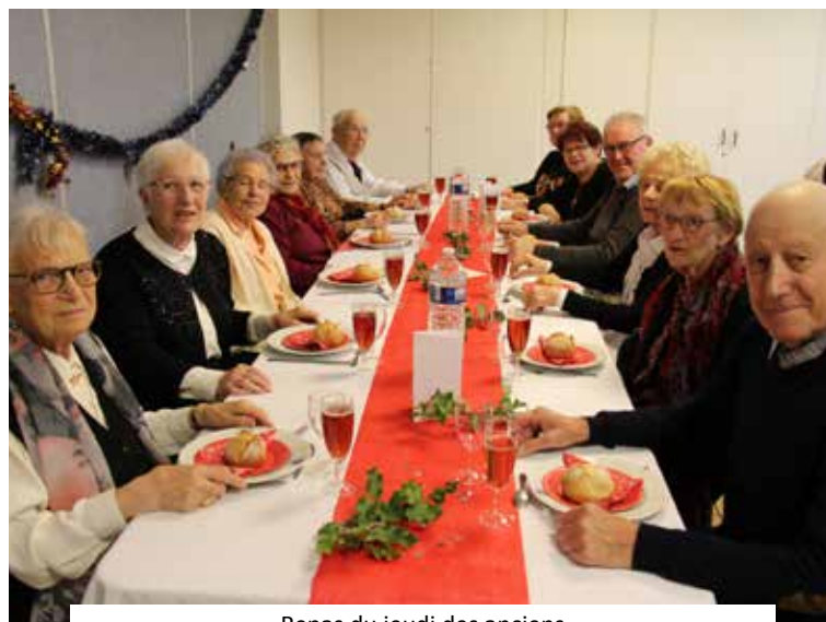
Repas du jeudi des anciens