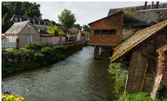
Le Moulin vendu par la ville sera transformé en habitation et gîtes.

Intégration de mobilier urbain le long du parcours (bancs, corbeilles, tables de pique-nique).